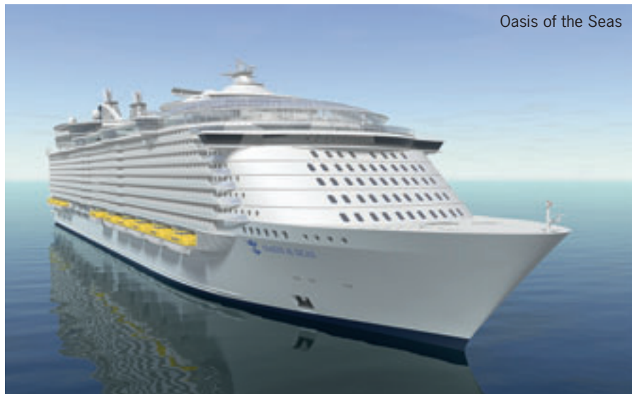
Oasis of the Seas