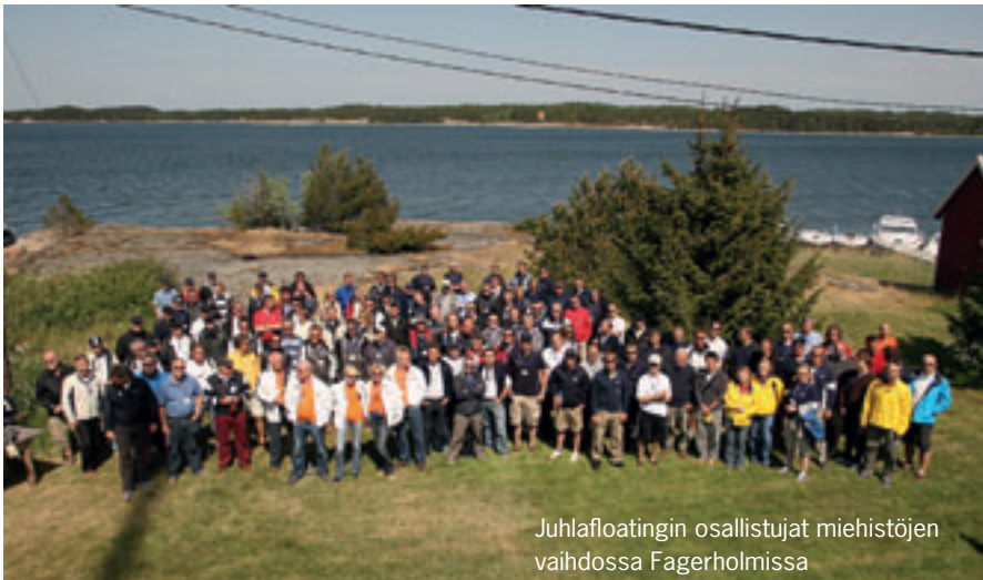
Juhlfloatingin osallistajat miehistöjen vaihdossa Fagerholmissa

Järjestyksessä 20. Finnboat Floating Show -tapahtuma järjestettiin Nauvossa kesäkuussa, tukikohtana tuttuun tapaan mainio Nauvon vierasvenesatama ja siellä hotelli Strandbo. Juhlavuoden tilaisuuteen osallistui sopivasti kaikkien aikojen suurin joukko toimittajia – peräti 60 lehtimiestä 24 eri maasta. Tapahtumaa voi todellakin hyvällä omatunnolla kutsua kansainväliseksi, sillä mukana olivat edustajat ”tavallisten” Euroopan maiden lisäksi myös mm. Turkista, Ukrainasta, Sloveniasta, Kroatiasta jne.