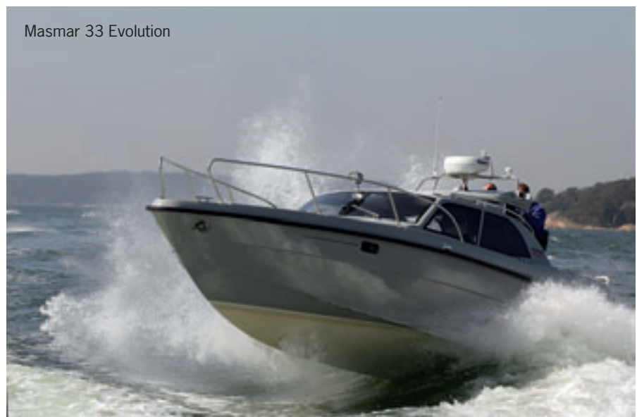
Masmar 33 Evolution

Wihuri Oy Power Products on Astra-Marinin valmistamien Masmar-veneiden ainoa jälleenmyyjä Suomessa ja vie veneitä myös muihin Pohjoismaihin ja Eurooppaan. Power Products panostaa jatkossakin Masmar-veneiden tuotekehitykseen ja jatkaa näin korkeatasoisten, täysin kotimaisten laatuveneiden perinteitä.