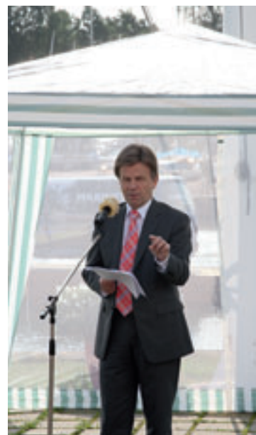
Elinkeinoministeri Mauri Pekkarinen avasi tämänvuotisen näyttelyn.

Helsingin uiva venenäyttely järjestettiin 31. kerran, tällä kertaa hieman ristiriitaisissa tunnelmissa. Kesästä ei elokuussa hemmotellut ainaakaan etelärannikon veneilijöitä, eikä se myöskään tehnyt sitä Uivan aikana. Kävijämäärässä jäätin jälkeen viimevuotisesta juhlanäyttelystä, mutta näytteilleasettajia ja esiteltäviä veneitä Lauttasaassa oli ennätysellinen määrä.