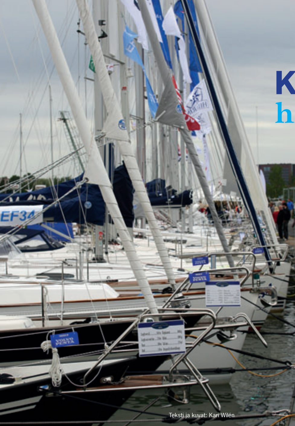
Teksti ja kuvat: Kari Wilén