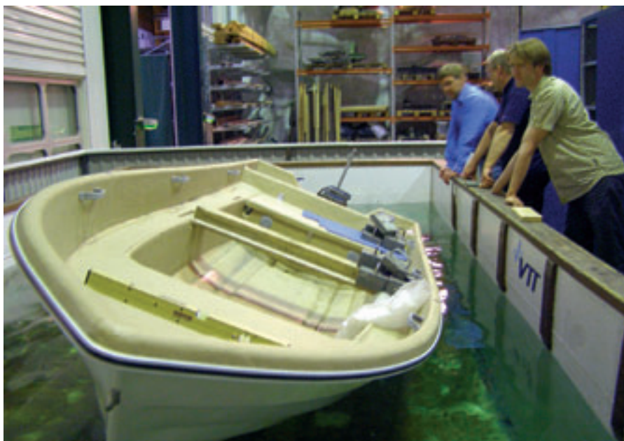
Tyypillinen vene, jolle uusi laitakuormakoe on ongelmallinen

Veneiden vakavuusstandardiin ISO 12217 on tullut muutos. Muutos on käsitelty ns. "amendment"-prosessin puitteissa, joka mahdollistaa asian nopeamman käsittelyn kuin normaali revisio. Välitön syy standardimuutokseen oli Englannissa sattunut onnettomuus, jossa menehtyi useita ihmisiä. Prosessi on kuitenkin kestänyt sen verran kauan, että sen aikana on myös aloitettu standardin määräaikainen revisio.