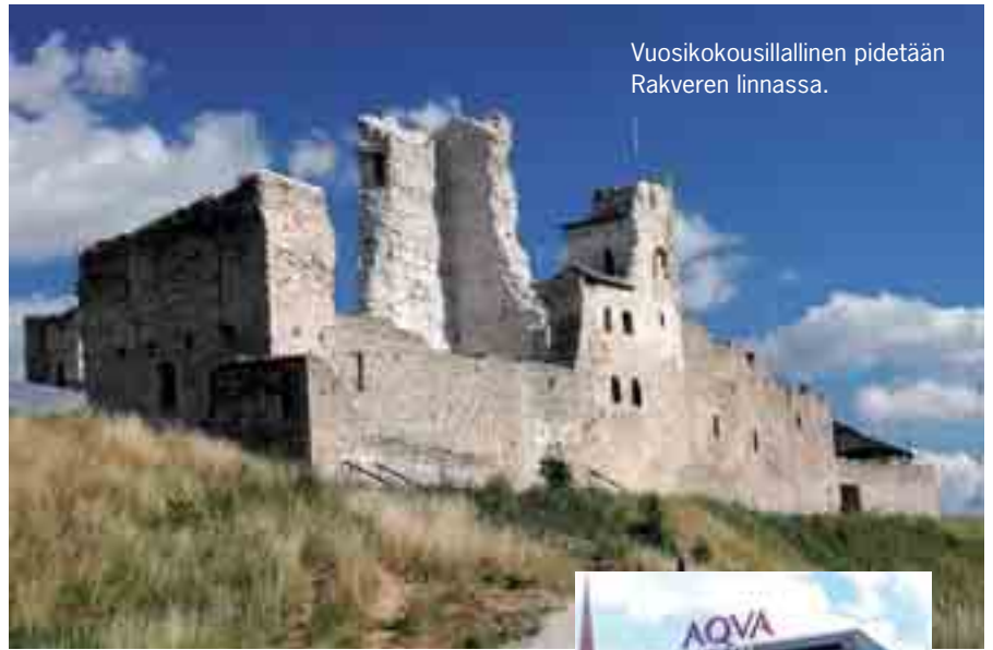
Vuosikokousillallinen pidetään Rakveren linnassa.

Klo 15.30 tilaisuus päättyy, jonka jälkeen on vielä mahdollisuus jäädä kokeilemaan VR-laitteita.