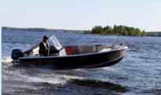
BUSTER M -veneestä on kirjoitettu Båttnytt (Ruotsi) ja Båtmagasinet (Norja) -lehdissä.