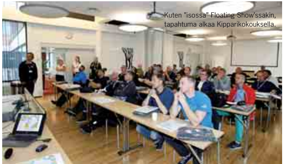
Kuten "isossa" Floating Show'ssakin, tapahtuma alkaa Kipparikoukksella.