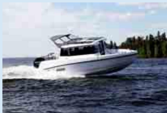
BELLA 620 C on esitelty seuraavissa venelehdissä: Båtmagasinet (Norja), Båttnytt (Ruotsi) ja Wassersport (Saksa).