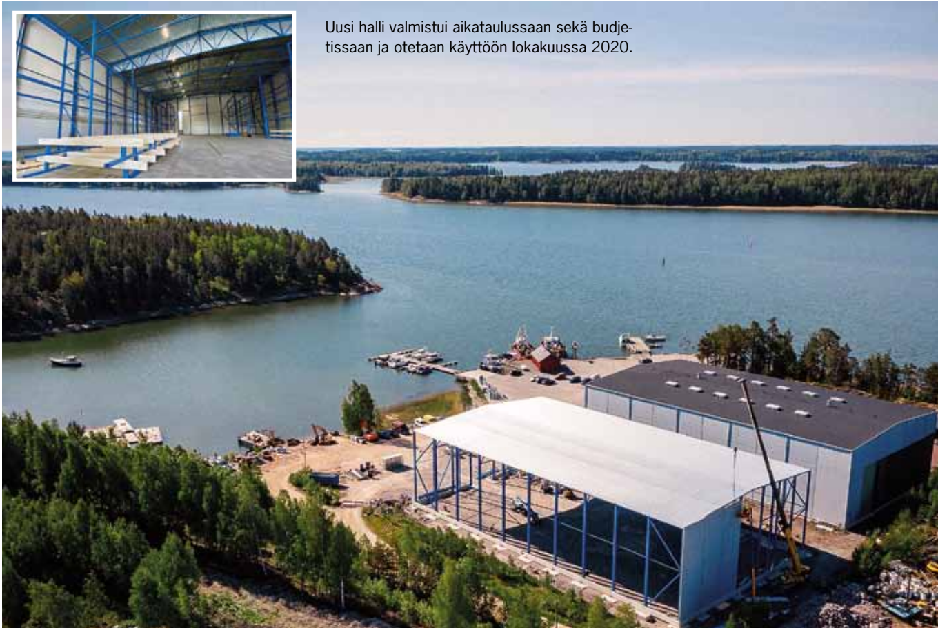
Uusi halli valmistui aikataulussaan sekä budjetissaan ja otetaan käyttöön lokakuussa 2020.

tuotettua sähköä. – Halleissa on nyt sähköä säästävä led-valaistus, joka myös helpottaa huoltotoimien tekemistä pimeään aikaan, Räme toteaa.