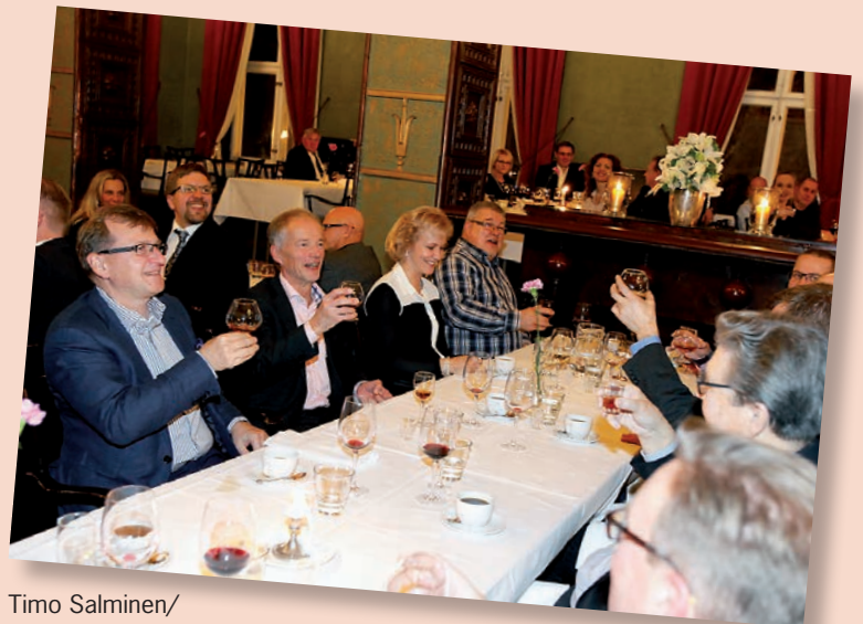
Timo Salminen/CCN Cruising Catamarans, Håkan Löfgren/Messukeskus, Minna Lahin/Maritim ja Sami Louhelainen/Emsalö Båtupplag