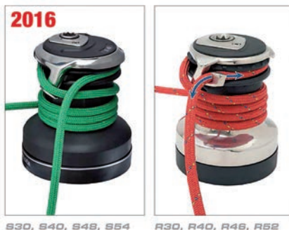
2016 S30, S40, S48, S54 R30, R40, R48, R52